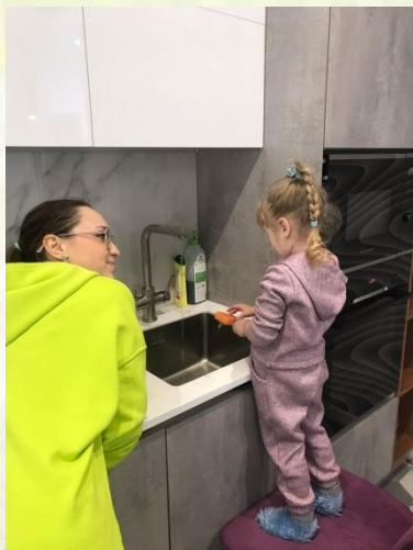
Фото –выставка. «Мамины помощницы»