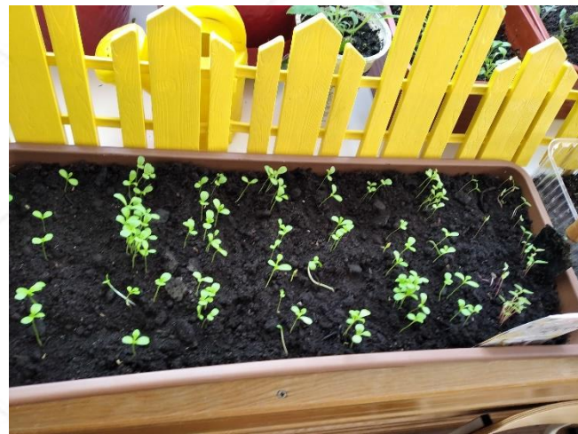
Гладиолус, вербена, хризантема