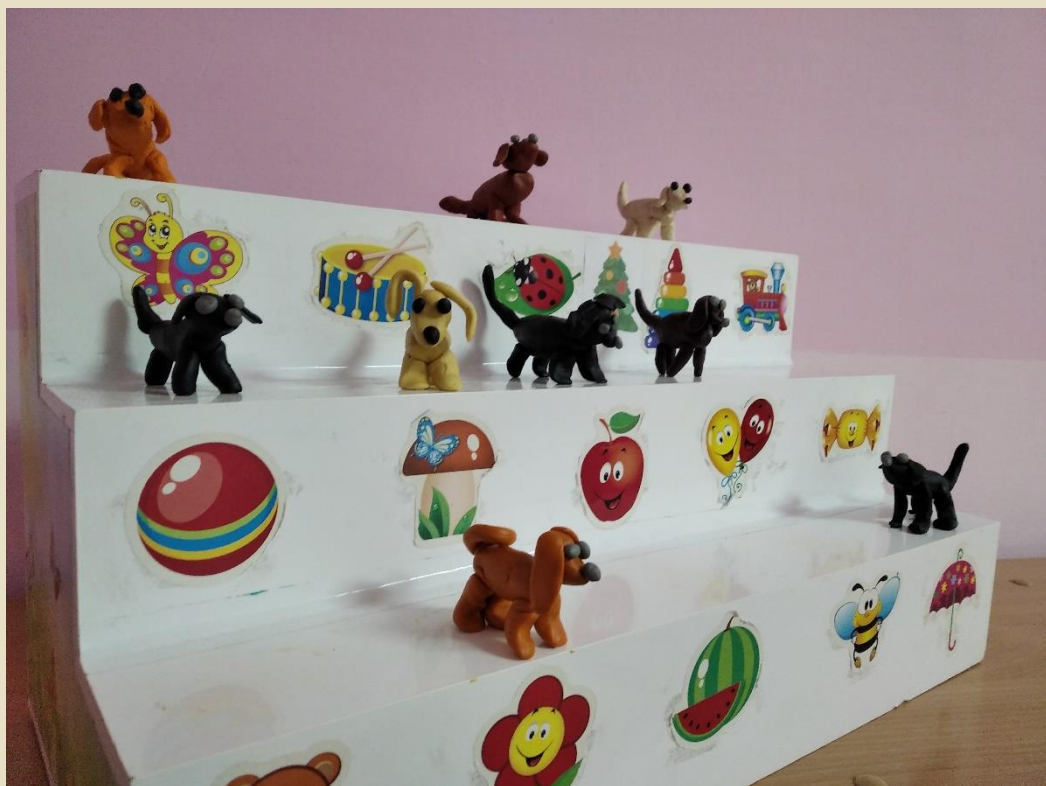
Рисование « Рыжий кот »