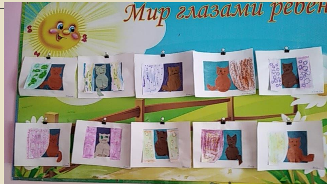
Аппликации на тему « Кошка на окошке», « Будка для щенка»