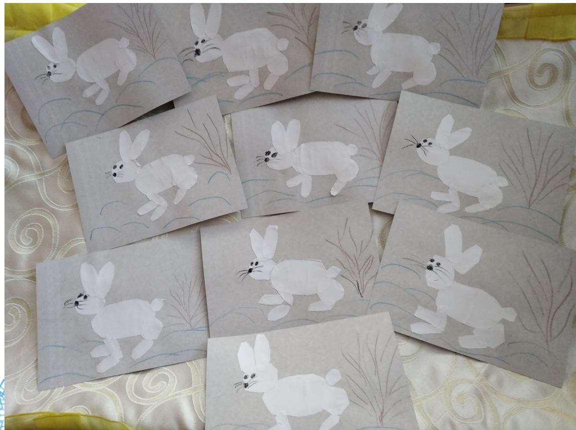
Аппликация «Зайчишка трусикша и храбришка»,