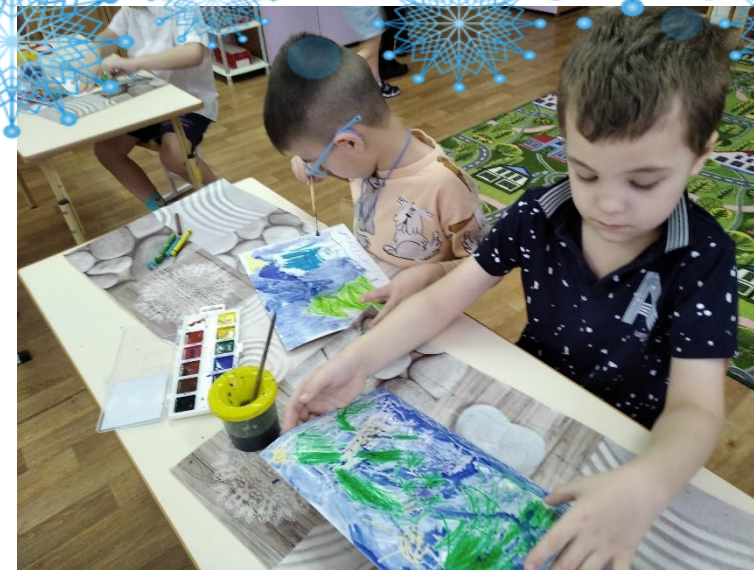
Рисование « Зима в лесу», «Еловая ветка»,