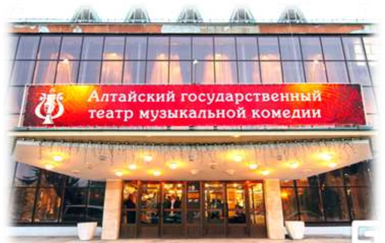
Театр музыкальной комедии